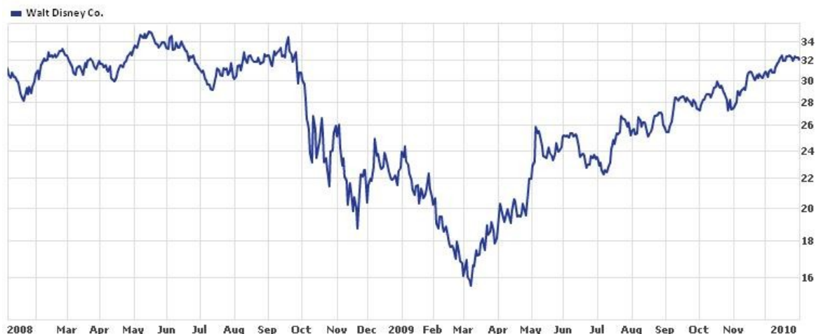
Graf 1 akcie Walt Disney Co.

V době krize, po pádu Lehman Brothers v září 2008, akcie společnosti Walt Disney Co. ztratily přes 50% své původní hodnoty.